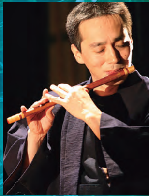
音楽: 木村俊介 Kimura Syunsuke